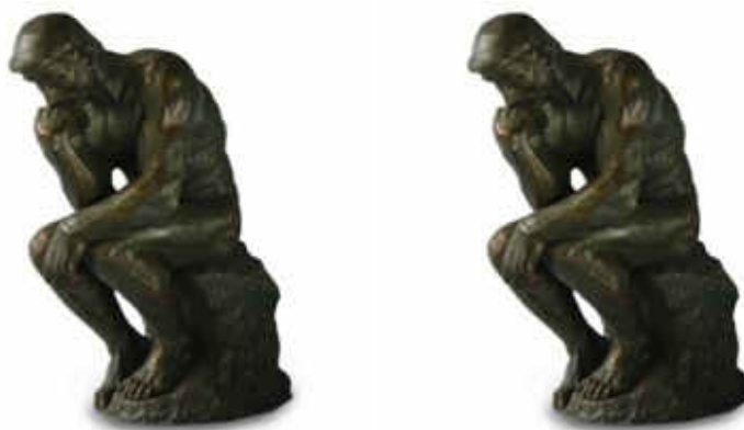
A gauche, Le Penseur , 1915, par Auguste Rodin. A droite, Le Penseur , 1930. La première œuvre s'est vendue pour 4 millions USD en 2011, la seconde pour 360'000 USD en 2010.

1858 Ltd est heureux de pouvoir proposer à ses clients un regard de spécialiste sur la mitigation des risques dans les domaines de l'assurance, la prévention de dommages et l'évaluation des risques. Qu'il s'agisse du transport, stockage, sécurité, ou de risques plus fréquents tels incendie, dégât des eaux et mauvaise manipulation, un rapport d'évaluation des risques et un plan d'urgence peuvent grandement minimiser les dégâts.