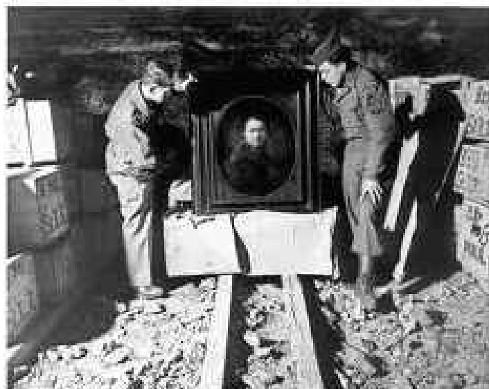
Deux 'monuments men' en train d'inspecter un « autoportrait » de Rembrandt. Ils vont être immortalisés par le prochain film de George Clooney.

Le tournage de 'Monuments Men' commencera en mars 2013.