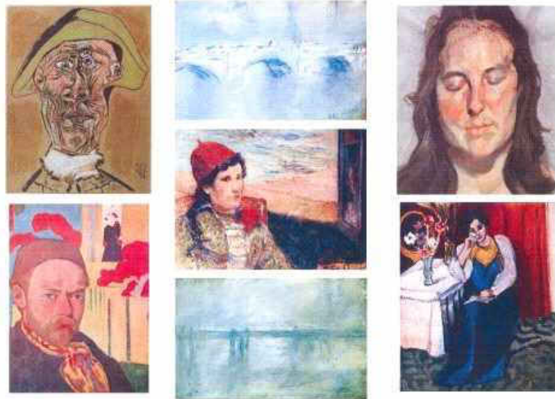
Les sept peintures volées au Kunsthall de Rotterdam le 16 octobre 2012.

Malgré l'objectif N.1 de la police de Rotterdam de récupérer ces peintures appartenant à la Collection de la Triton Foundation, aucun développement ne semble avoir vu le jour depuis. De nombreux experts craignent que ces œuvres ne disparaissent dans des coffres-forts pour des dizaines d'années ou plus.