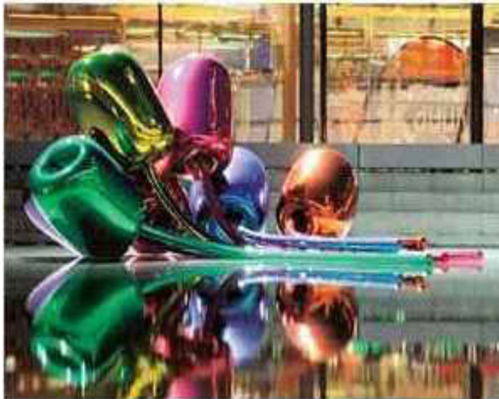
Jeff Koons, 'Tulips', 1995 – 2004, vendu à Christie's New York le 14 novembre pour $33,7 millions, battant le record du meilleur prix de vente aux enchères pour l'artiste.