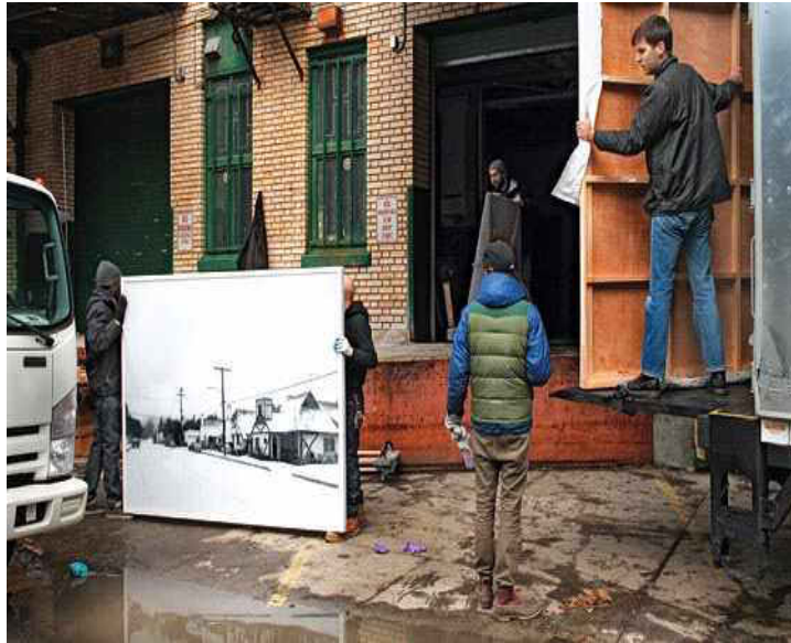
Une œuvre photographique en train d'être retirée de la 303 Gallery, Chelsea, NY