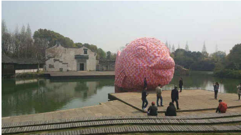
Florentijn Hofman's Floating Fish à Art Wuzhen. Credit photo : designrends.com