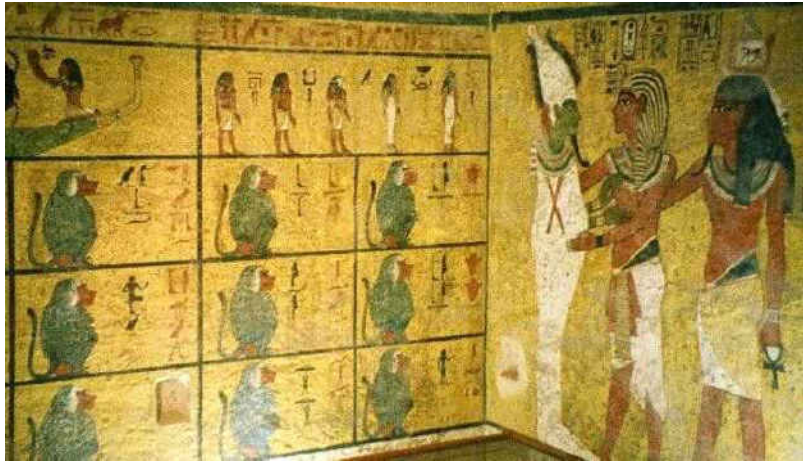
Décorations murales dans la chambre funéraire de Toutankhamon.