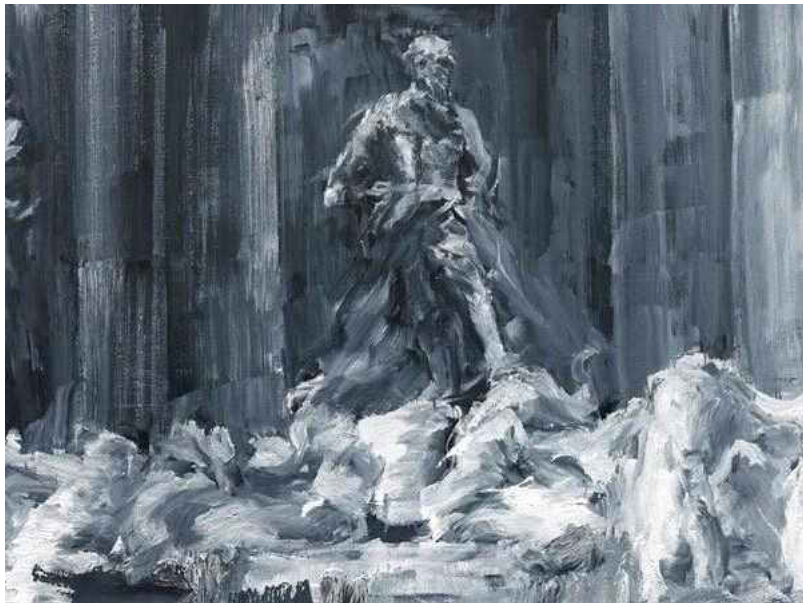
Yan Pei Ming, La Fontaine de Trevi

Cette exposition met en lumière la relation privilégiée entre l'Académie Française de Rome, qui fête actuellement ses 350 ans, et la ville qui l'accueille.