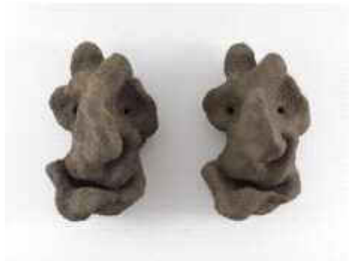
Ugo Rondinone, Kiss Now Kill Later, 2 parties (2010) vendu pour £140,000 à l'Amory Show

Aux mêmes dates se tenait le 25è Art Show, organisé par