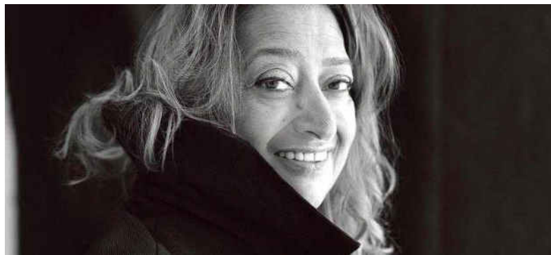
Zaha Hadid