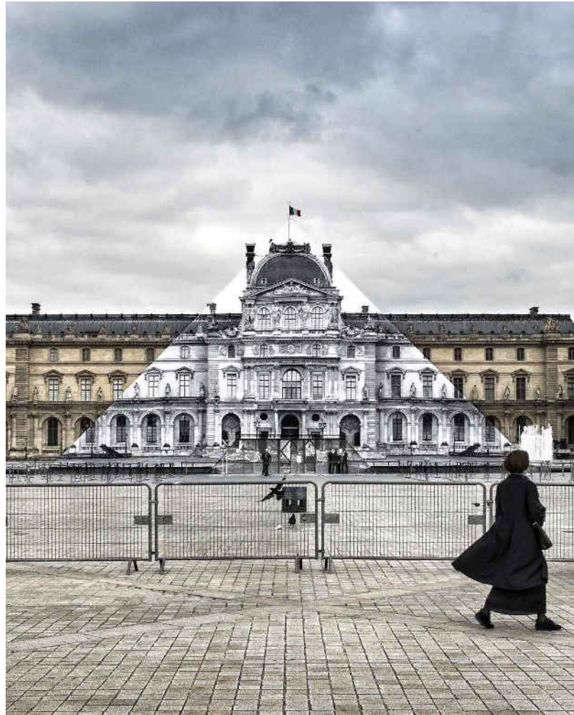
L'installation de JR au Louvre