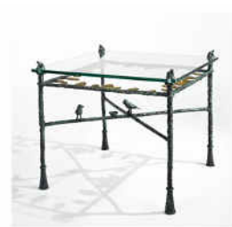
De gauche à droite : les records du printemps de Marc Newson, Serge Mouille et Diego Giacometti