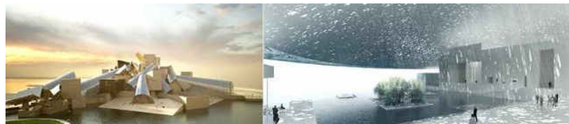
Abu Dhabi: le futur Guggenheim (Gehry Partners). A droite: projet pour Le Louvre (Jean Nouvel)

Ces conditions sont d'ailleurs en ce moment sujettes à enquête de la part de Human Rights Watch et Gulf Labor; en parallèle, l'artiste Molly Crabapple a réussi à se glisser sur le chantier du futur Guggenheim pour y collecter des témoignages et preuves de l'exploitation humaine en cours.