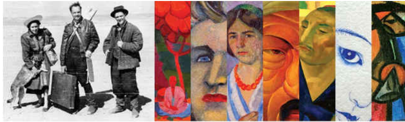
Igor Savitsky (center) pendant l'expédition de 1950; mosaïque d'oeuvres de la Collection Savitsky.

www.savitskycollection.org ; www.desertofforbiddenart.com