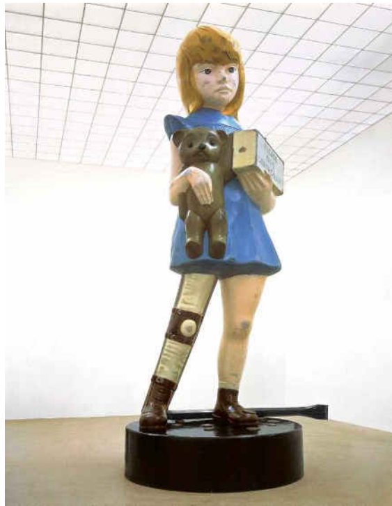
Damien Hirst, Charity (2002-2003)